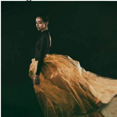
YELLOW SKIRT BALLERINA

Traurige Ballerina im Fenster des Übungsraumes