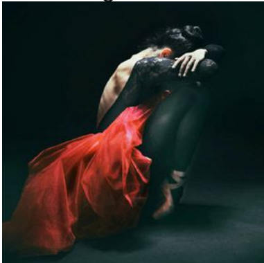
RED SKIRT BALLERINA

Eine farbige Ballettschülerin posiert vor der Kamera