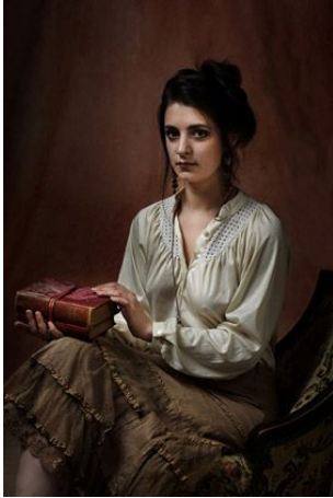
LAST CENTURY MOOD