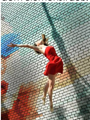
THE BIG JUMPING

Das Mädchen ist etwas mollig und entspricht nicht dem heutigen dünnen Schönheitsideal. Sie kann sich so nicht zeigen und versteckt sich lieber hinter dem Blumenstrauß.